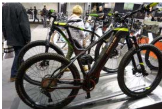
Veel elektrisch op Velofollie.

Het fietsgebruik in België wint nog steeds in populariteit. Elektrische fietsen maken daarbij een nog groter deel uit dan in Nederland: met bijna 50% marktaandeel is 1 op de 2 nieuwe fietsen in België uitgerust met elektrische aandrijving. In Nederland is 33% van de verkochte fietsen elektrisch.